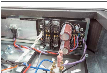
Die Kabelführung im Inneren ist sehr aufgeräumt. Alle Spannungen werden sauber gefiltert