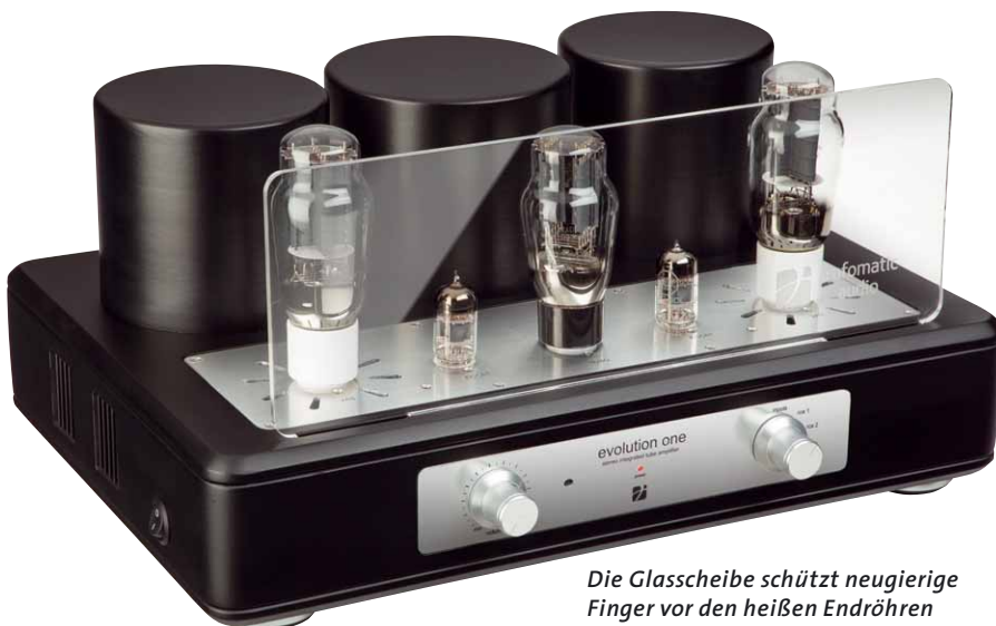
Die Glasscheibe schützt neugierige Finger vor den heißen Endröhren