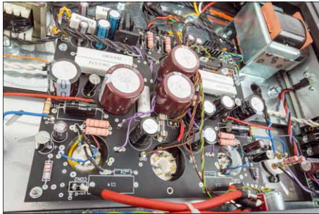
Im Inneren finden wir eine Mischung aus Platinen und freier Verdrahtung