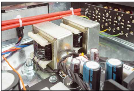
Statt einer RC-Filterung hat man sich an vielen Stellen für die aufwendigere (und teurere) LC-Filterung entschieden

struierten „Ephedra“, einer Kombination aus einem 12-Zoll-PA-Treiber und einem Hochtonhorn konnten wir dann auch mal die Wände wackeln lassen, so dass alle Kollegen im Verlagsgebäude etwas davon hatten. Im Bass reicht das immer noch nicht ganz an die Transistorkollegen mit ordentlich Gegenkopplung heran, ist aber potent genug, um auch mal den einen oder anderen gemeinen Tritt auf das Pedal der Bassdrum in die Magengrube fahren zu lassen. Und die grollenden Kontrabässe eines ganz großen Symphonieorchesters, bei der Peer-Gynt-Suite oder der Ouvertüre zum Fliegenden Holländer, haben Autorität und Schwärze. Die wahre Stärke des Evolution One offenbart sich aber etwas weiter oben im hörbaren Bereich: Stimmen, Naturinstrumente und ihre Obertöne gibt die Kombination so leidenschaftlich, offen und lebendig wieder, dass man sich ganz nahe dran am Livekonzert fühlt. Die räumliche Abbildung ist dabei höchst organisch – die Raumaufteilung ist weit und tief, dabei klar nachvollziehbar und exakt, vielleicht ohne das letzte Quäntchen Kantenschärfe, das Verstärker anderer Bauart zu liefern imstande sind. In Sachen Charme und Farbenpracht muss sich der Trafomatic vor keinem anderen verstecken.